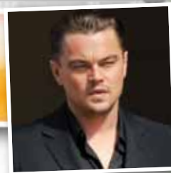
Leonardo Di Caprio

Molto importante è inoltre il contributo al cinema di numerosi artisti italoamericani: ad esempio registi come Martin Scorsese e Francis Ford Coppola o attori come Robert De Niro, Al Pacino, John Travolta, Sylvester Stallone e Leonardo di Caprio!