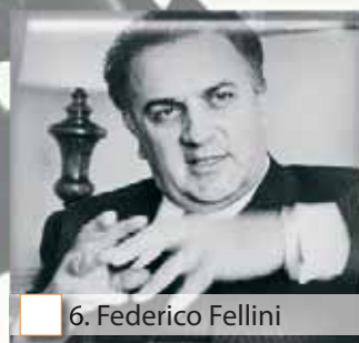
6. Federico Fellini