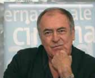
4. Bernardo Bertolucci