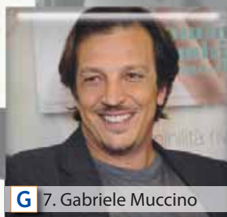
G 7. Gabriele Muccino