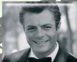
2. Marcello Mastroianni