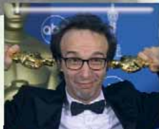
3. Roberto Benigni