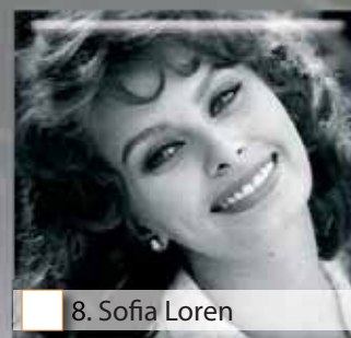
8. Sofia Loren

Molto importante è inoltre il contributo al cinema di numerosi artisti italoamericani: ad esempio registi come Martin Scorsese e Francis Ford Coppola o attori come Robert De Niro, Al Pacino, John Travolta, Sylvester Stallone e Leonardo di Caprio!