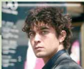
1. Riccardo Scamarcio