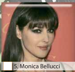
5. Monica Bellucci