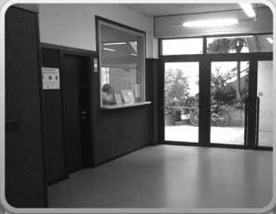
3. Il ...