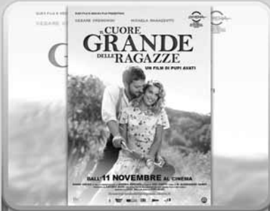
4. La ... del film