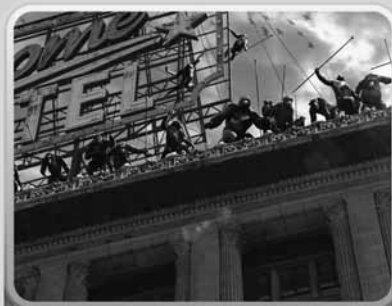
2. Film di ...