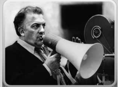
8. Federico Fellini è un ...