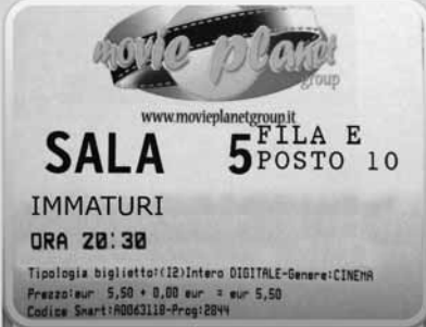
7. Il ...