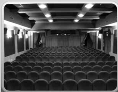
1. Sala ...