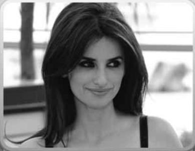
6. Penélope Cruz è un'...