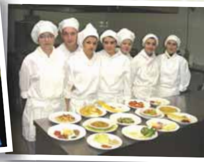
fare lezioni di cucina