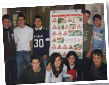
fare lezioni di guida