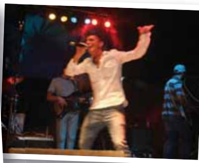
cantare in un concorso