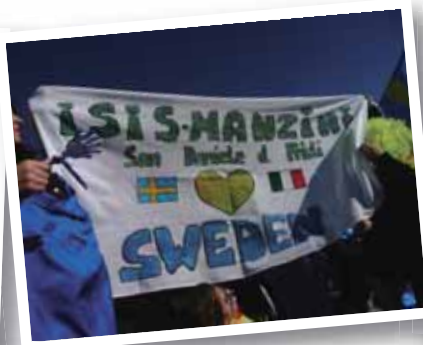
fare il gemellaggio con un'altra scuola