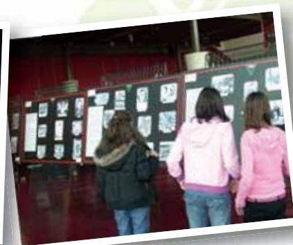
organizzare una mostra