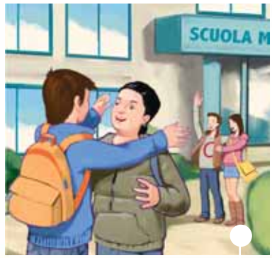
rivedere gli amici

1 Osservate le immagini e discutete: cosa è più bello il primo giorno di scuola?