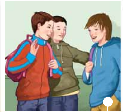
conoscere nuovi compagni