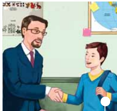
ritrovare i professori